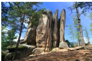
Особо охраняемые природные территории (ООПТ)